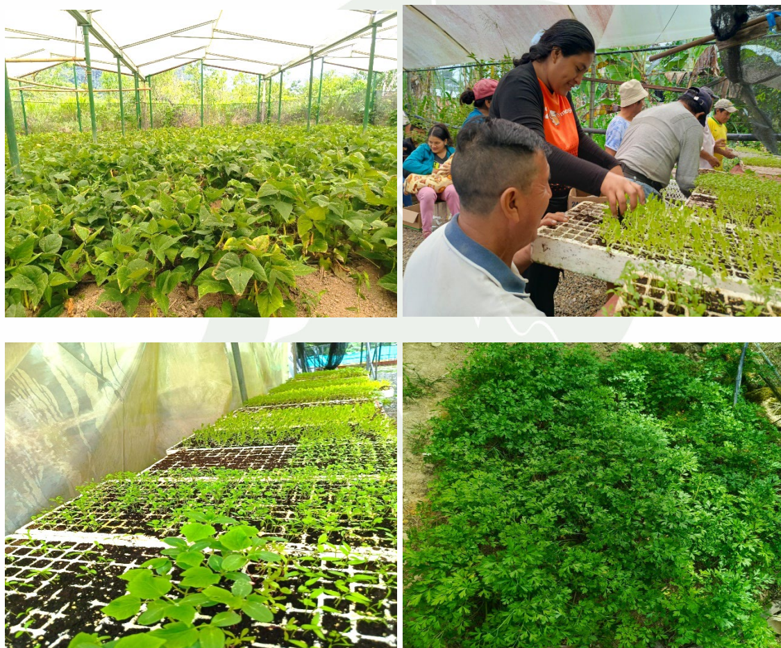
Ilustración 3. Producción agrícola de Bellavista.

Dentro de las hortalizas los habitantes de bellavista, producen zanahoria, tomate, cebolla hoja, pepino, pimientos, perejil, culantro, acelga, lechuga de repollo y de la churona.